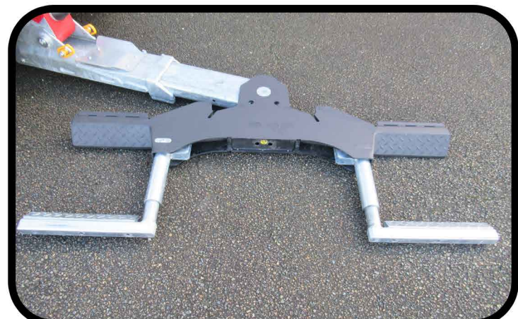
* Panier type US avec fourches articulées hydrauliquement et radiocommandées.