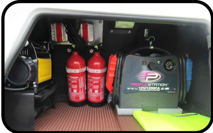
* Booster 12V avec station de recharge dans le véhicule.