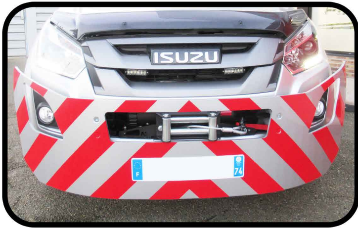
* Treuil électrique 4T encastré dans le pare chocs avant et couplé avec la commande radio.