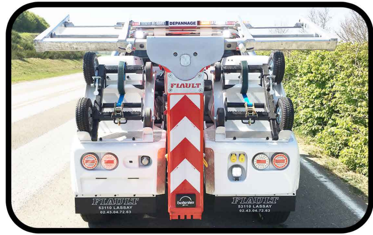
- Feux de signalisation AR 100% leds, phares de travail, prises de remorque et de démarrage 12V.