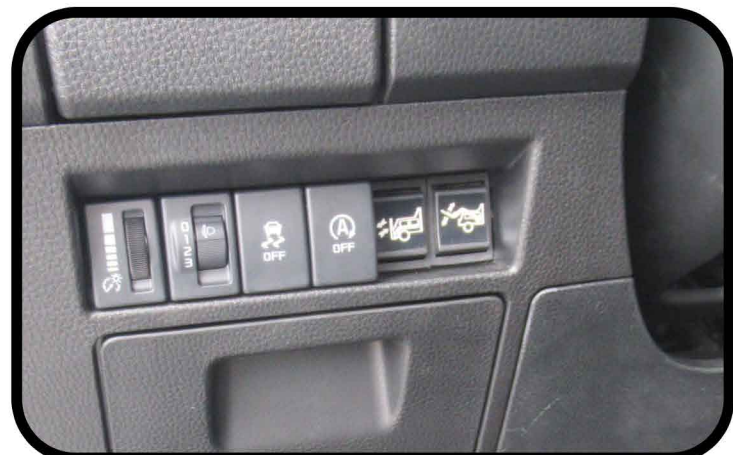
* Coupe circuit électronique et deux interrupteurs en cabine pour élévation et correction du bras.