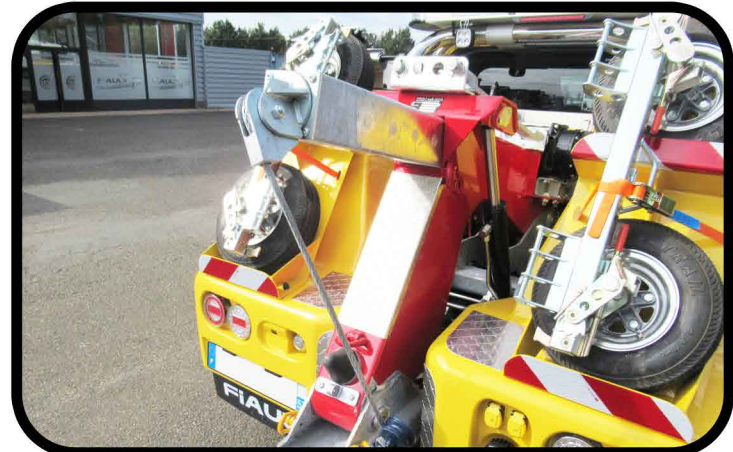
* Une flèche de relevage extensible manuellement avec une tête de grue pivotante.