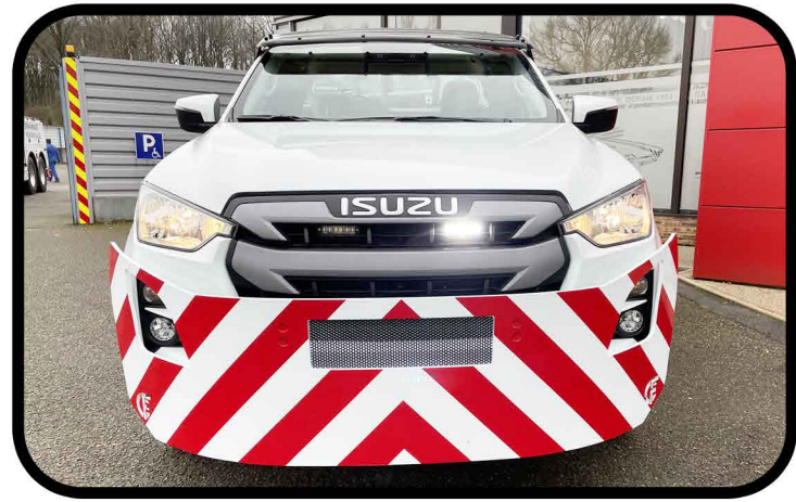
* Pare buffle en acier et visière au-dessus du pare brise.