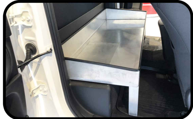
* Cabine profonde avec possibilité d'aménagement de la partie arrière en bac de rangement pour batteries.