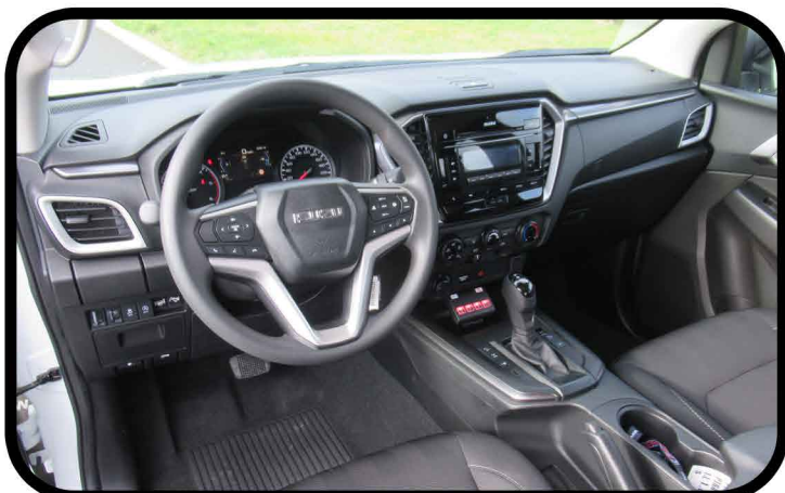
- Ecran d'origine avec caméra de recul et contrôle de la signalisation en cabine.