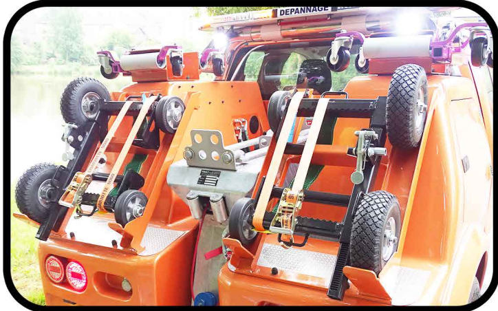
* Chariots de dépannage à roues gonflables type FOURRIERE et à roues pivotantes type Go-Jack.