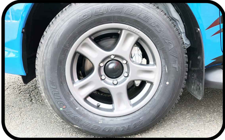
* Remplacement des 4 jantes d'origines par des jantes en ALUMINIUM renforcées couleur grises.