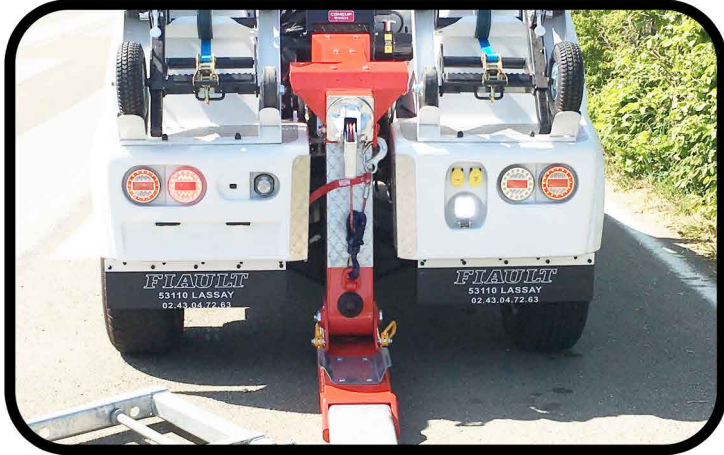
* Peinture du bras de remorquage en un ton uni standard.