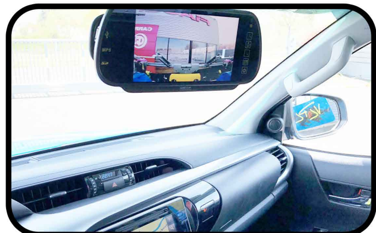
* Caméra de surveillance avec écran plat sur le rétroviseur central