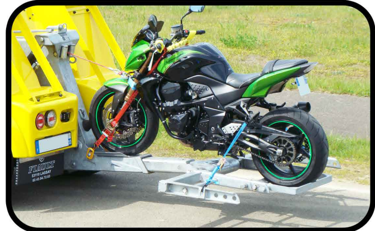
* Equipement porte moto avec adaptation simple et rapide.