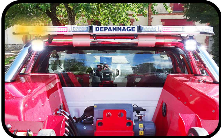
- Rampe lumineuse extra-plats avec rappel des feux de signalisation, treuil électrique 4T avec poulie.