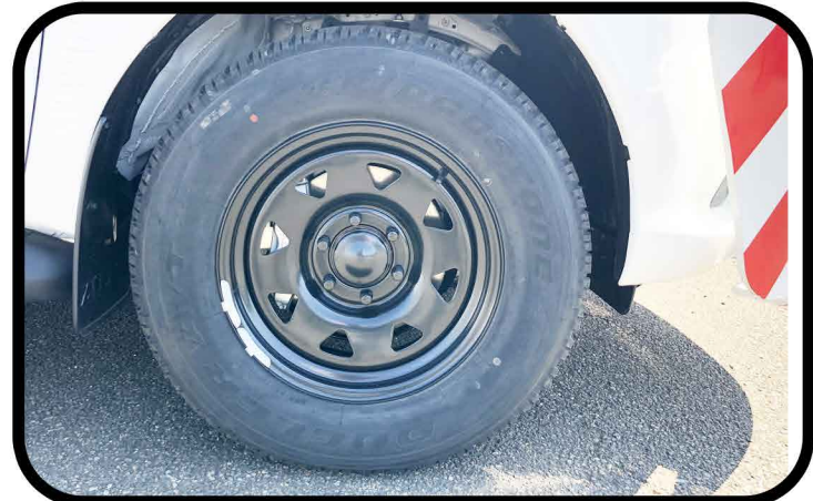
* Remplacement des 4 jantes d'origines par des jantes en ACIER renforcées couleur noires.