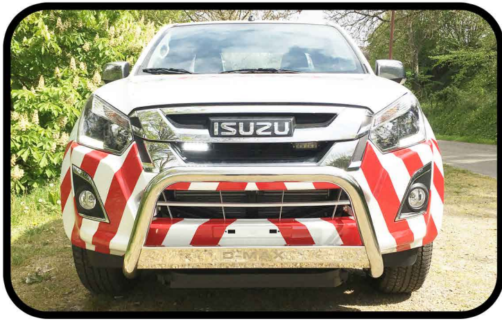
* Pare buffle chromé et feux de pénétration BLANC. Lest anti-cabrage positionnés sous le pare-chocs AV.