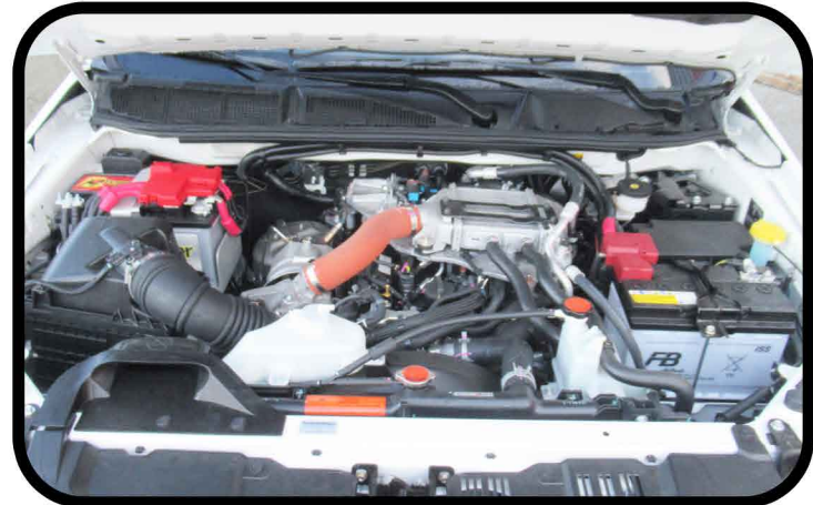
* Adaptation d'une deuxième batterie dans le compartiment moteur.