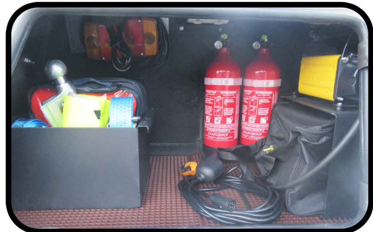
* Compresseur d'air avec flexible et manomètre de pression.