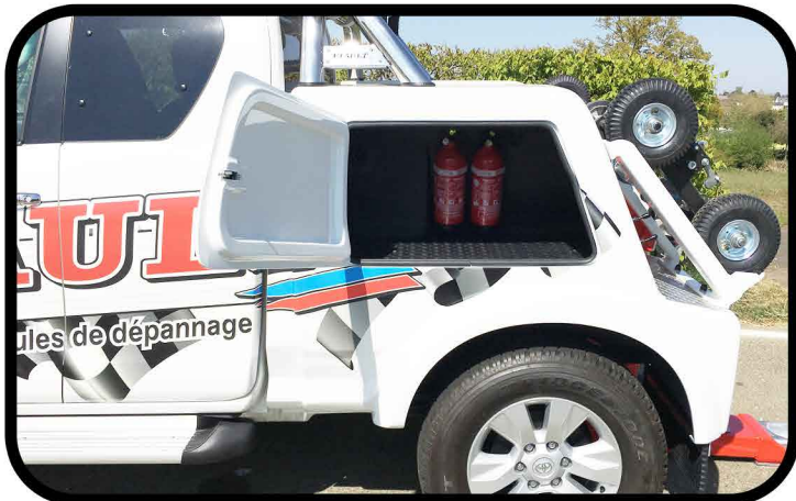
- Coffres de rangement grand volume avec éclairages à leds, équipements carte blanche.