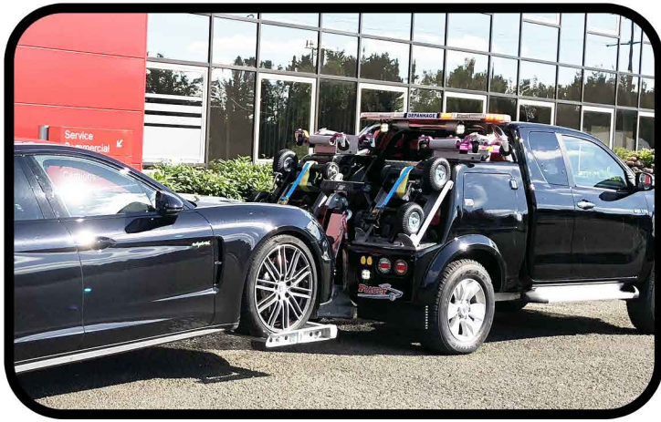
- Suspension pneumatique arrière avec correcteur d'assiette automatique et abaissement possible.