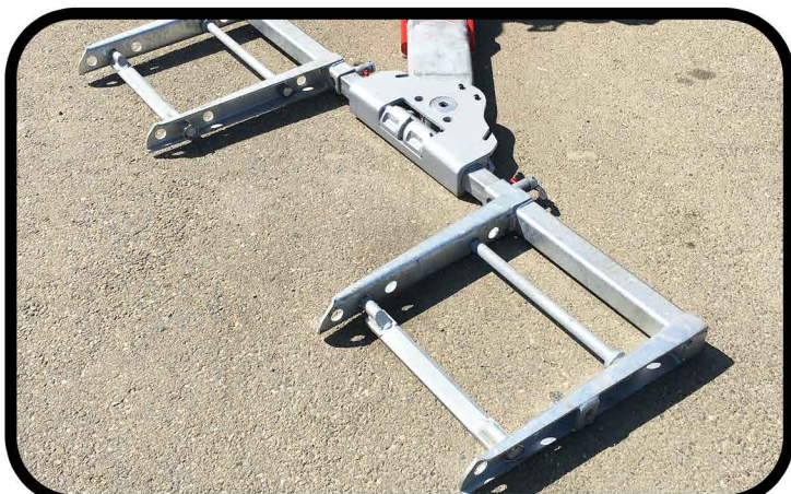
- Tubes et fourches du panier extra-plats et entièrement galvanisés avec extension hydraulique.