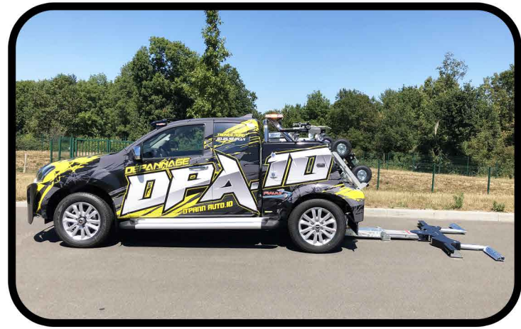
* Peinture de la cabine d'une couleur non disponible d'origine constructeur.