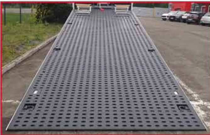
- Plancher en tôles d'acier anti-dérapantes et peintes avec PERFORATION INTEGRALE sans bords de rives