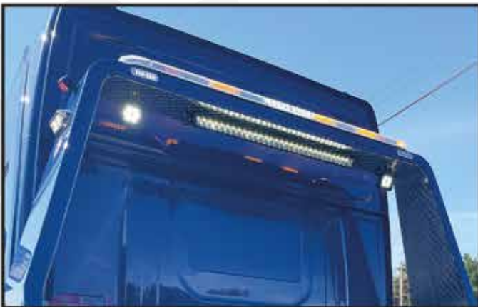
* Rampe de signalisation avec feux à leds installée sur la cabine ou sur le fly et rappel des feux.