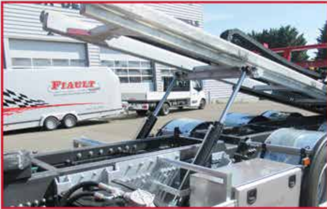
* Positionnement des deux vérins de basculement sur le côté extérieur du châssis.