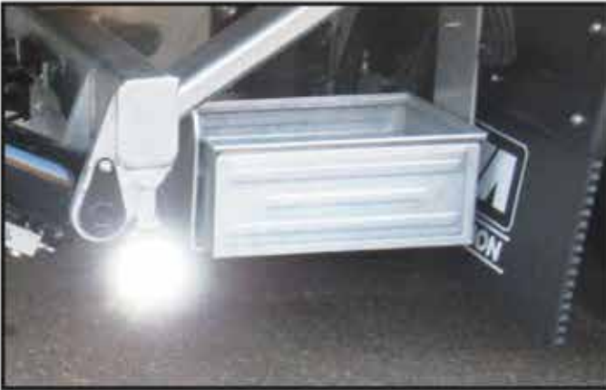
* Un bac galvanisé ouvert pour chaînes avec support fixe.