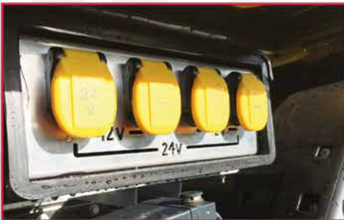
* Deux câbles de démarrage avec deux prises 12V et 24V dans un coffre fermé.