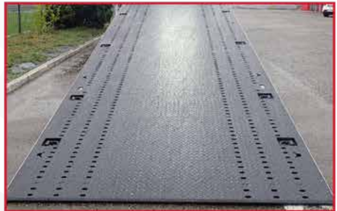
* Plancher en tôles renforcées à LARMES PEINT ép. 5/7mm sans bords de rives.