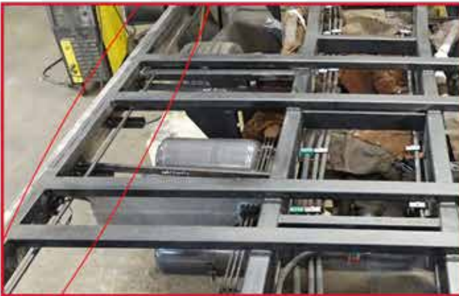
* Système d'accrochage de sangles soudé sous le plateau des 2 côtés pour arrimage avec sangles.