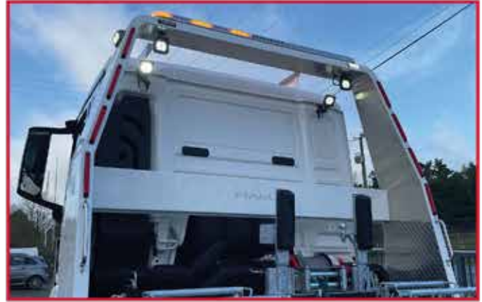
* Roll-bar surélevé type FLY, rampe lumineuse avec rappel des feux, feux flash et éclairage à leds.