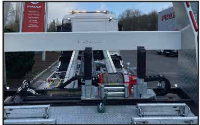
* Treuil hydraulique 7T1 avec déplacement transversal hydraulique par radio commande.