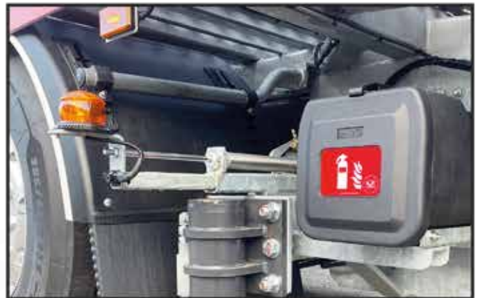
* Un gyrophare à leds extensible par vérin pneumatique installé dans le port à faux arrière.