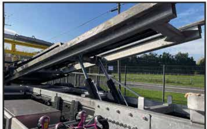
- Galvanisation intégrale du faux châssis, basculeur, accessoires et supports.