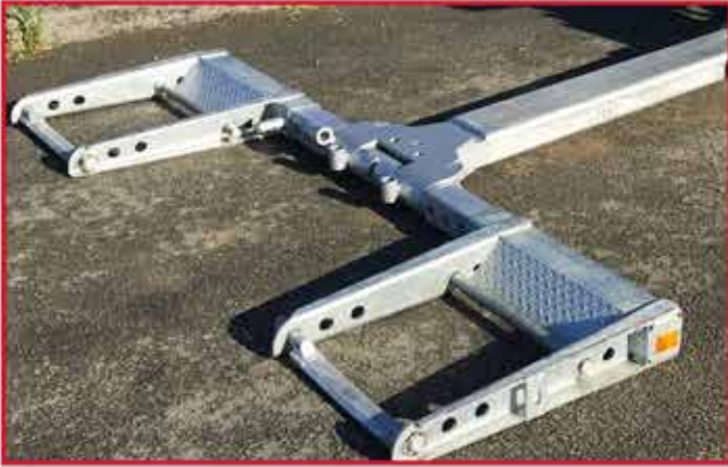
* Combiné flèche panier galvanisé et réglable type COMBILIFT 3T - 4T avec tête de grue.