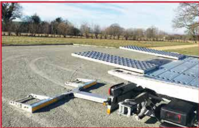
* Deux rampes aluminium 1250x500 mm adaptables en bout de plateau pour rallongement de celui-ci.