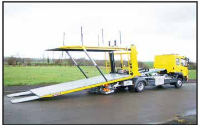
* Demi étage type 3 : élévation de l'AV par vérins + chaînes et élévation de l'AR par vérins.