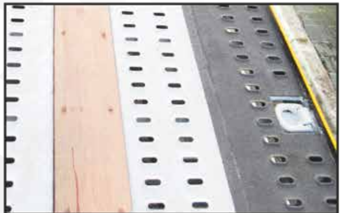
* Anneaux d'arrimage 7T articulés et encastrés dans le plancher et anti-dérapant sur le côtés.