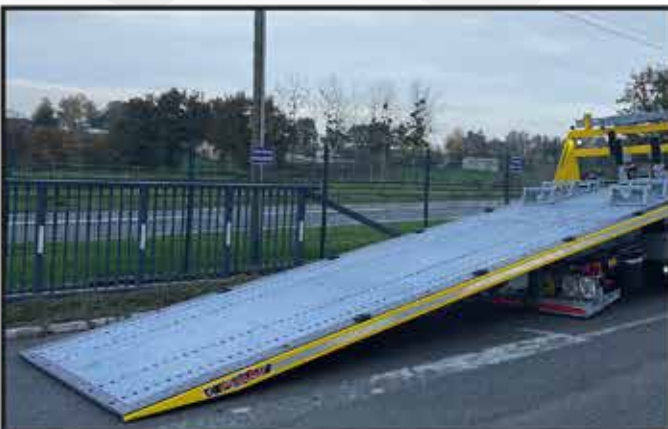
* Galvanisation à chaud de l'intégralité du plancher en tôles à larmes.