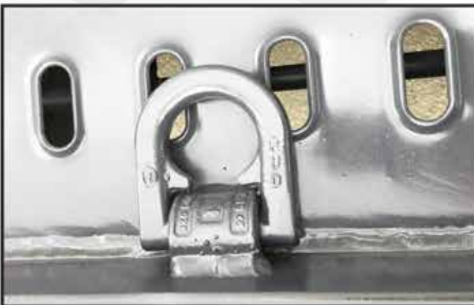
* Anneaux d'arrimage 7T articulés et soudés sur le plancher pour arrimage avec sangles.