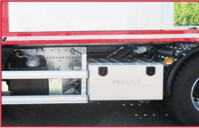
* Coffre à outils en inox avec porte articulée longueur 800 ou 1000 mm et ridelles emboîtables.