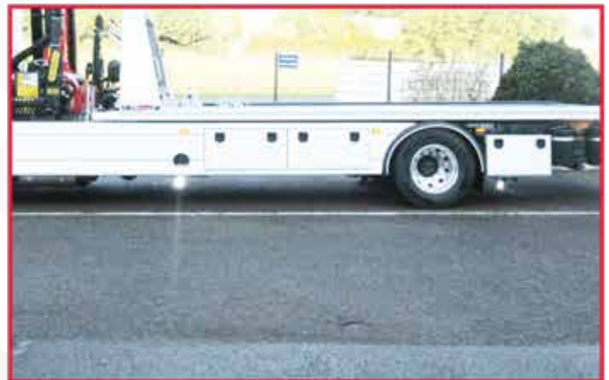
* Carénage stylisé de l'empattement seul en aluminium et feux périphériques.