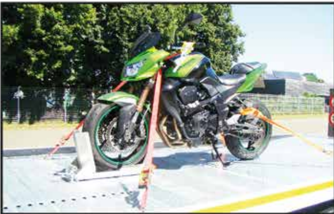
* Kit spécial cale moto avec sabot articulé, sangles et support sur l'équipement.