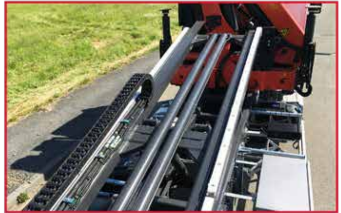
* 2 vérins de coulissement à double effet avec clapets de sécurité sur TP120 et TP150.