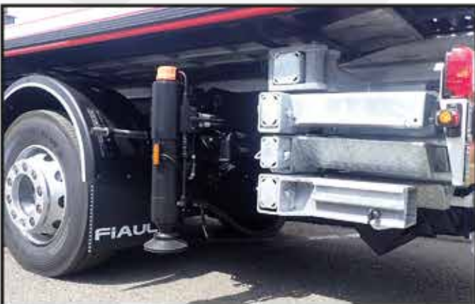
- 2 béquilles arrières hydrauliques fixées sous le châssis sur une traverse derrière le dernier essieu.