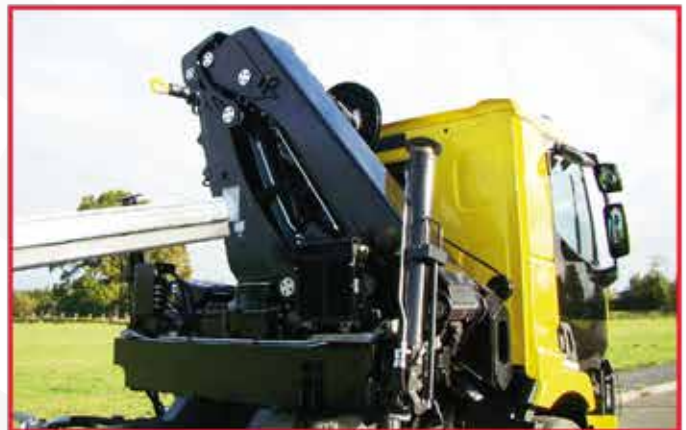
* Fourniture et installation d'une grue hydraulique derrière la cabine selon votre besoin.