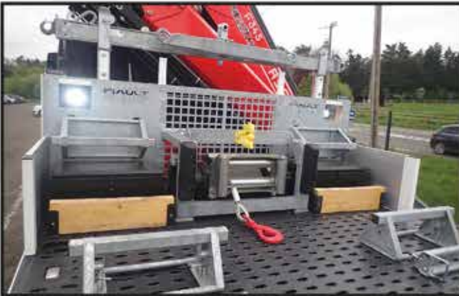
* Roll-bar spécial TP avec grillage de protection de cabine, 2 coffres de rangement et 2 bastaings