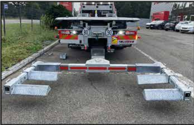
* Un panier de remorquage HYDROLIFT 10T.