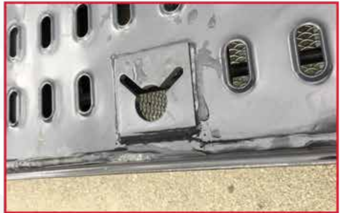
* Têtes d'arrimage encastrées dans le plancher pour arrimage avec chaînes.