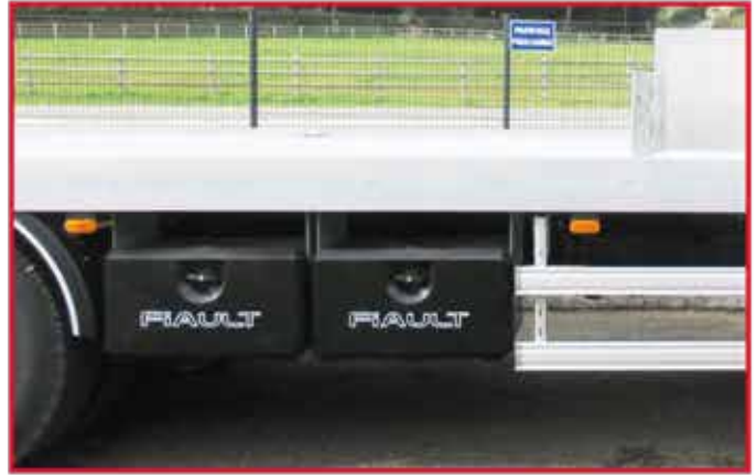
* Coffre à outils en polyuréthane avec porte articulée longueur 800 ou 1000 mm.