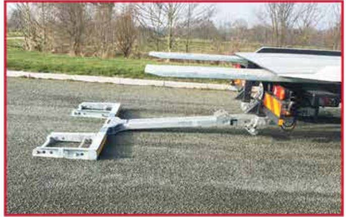
* Panier de remorquage avec double extension hydraulique à 1800mm et rampes hydrauliques.