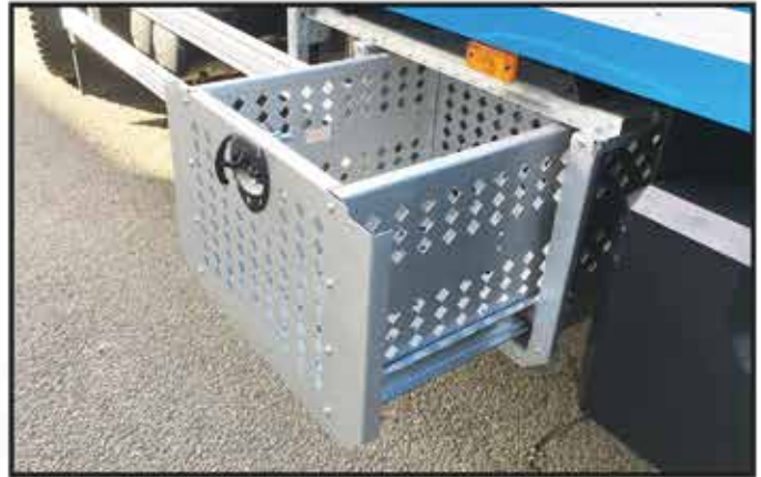
* Un bac galvanisé ouvert pour chaînes avec support coulissant.