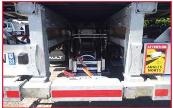
* Un treuil hydraulique 3T6 pu 4T5 installé sur le panier de remorquage avec une commande radio.