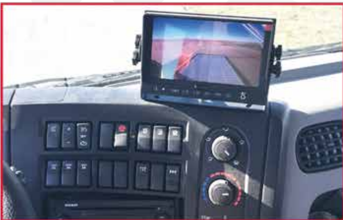
* Une caméra de recul en couleur avec écran plat dans la cabine.