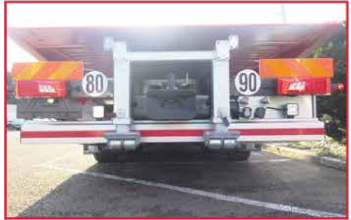
* Un crochet d'attelage pour remorque installé sur une traverse fixe à l'arrière.