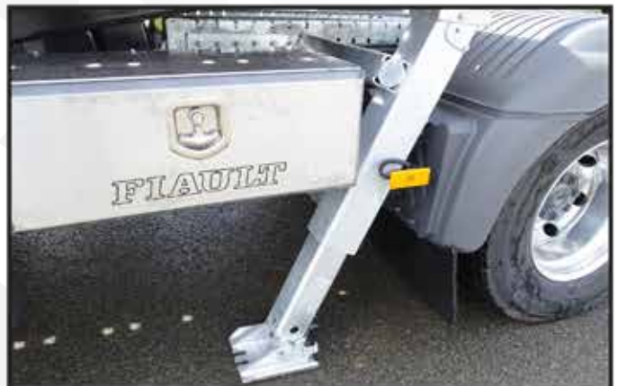
* Bêches hydrauliques à patins pivotants avec doigts d'ancrage au sol.