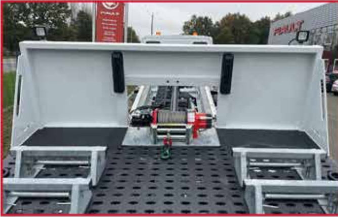
- Roll-bar standard de protection de cabine avec 2 butoirs caoutchouc.