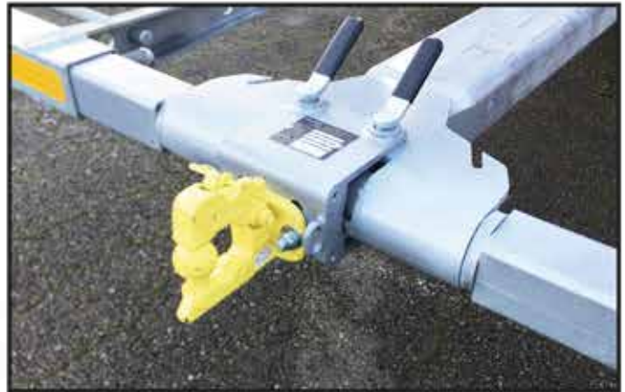
* Chape + boule adaptable sur panier de remorquage.