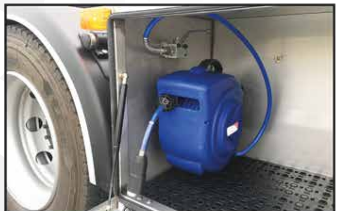
* Un enrouleur pneumatique avec tuyau dans un coffre à outils.