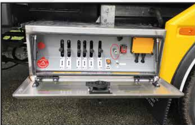
* Coffre de commandes hydrauliques avec prise d'air et débrayage pneumatique du treuil.