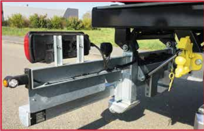
* Pare chocs avec signalisation pivotant hydrauliquement pour accès au crochet d'attelage.