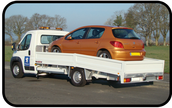
* Ridelles de protection en aluminium