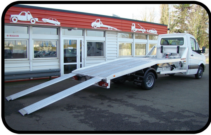
- Faux châssis et plateau les plus légers du marché