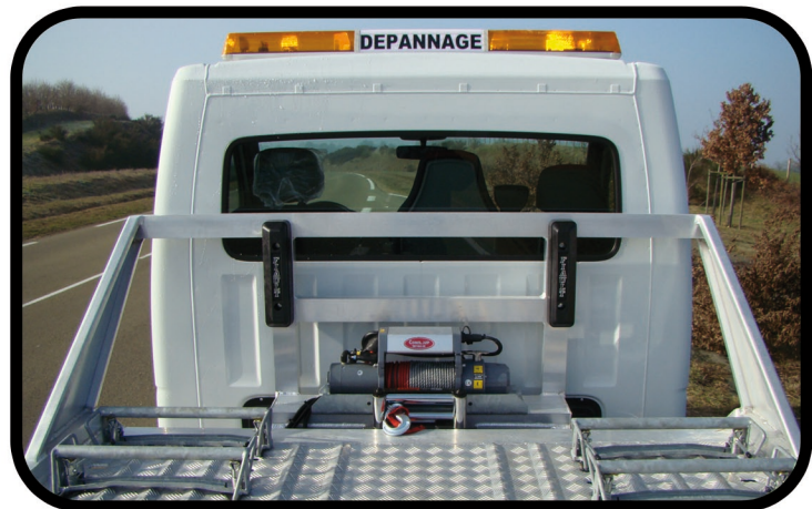
- Roll bar de protection de cabine avec butoirs caoutchouc - Equipement en série