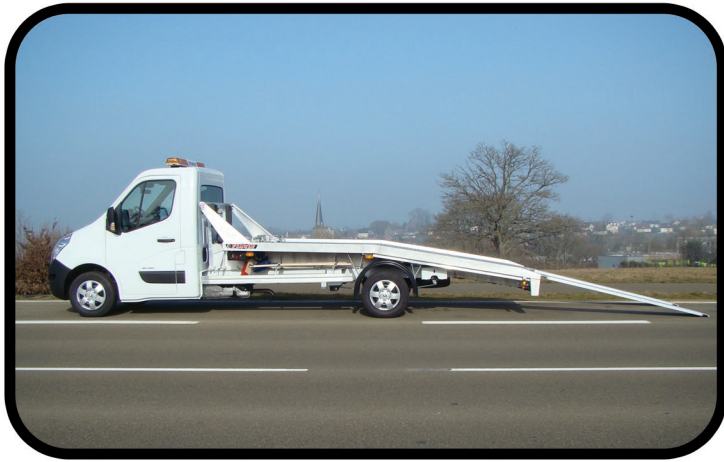
- Structure du plateau optimisé pour obtenir un faible angle de chargement