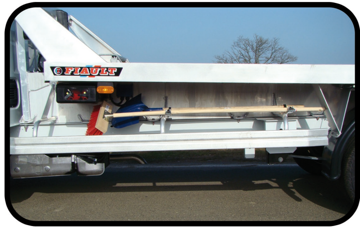
* Equipement carte blanche pour dépannage