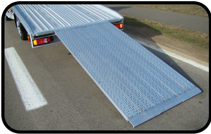
* Rampe centrale pour chargements spéciaux