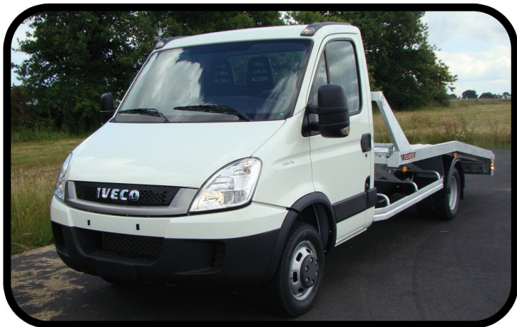
- Fonctionnement simple et efficace de l'ensemble