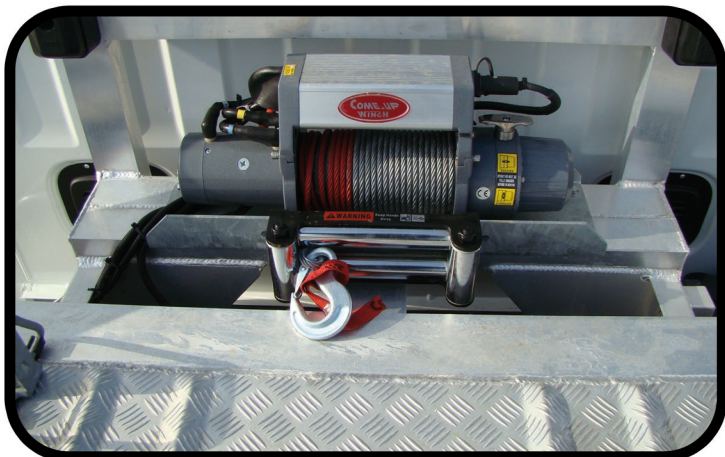
- Treuil électrique 4T avec commande par fil