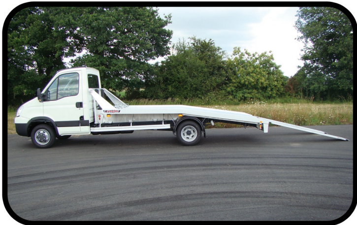
- Structure du plateau optimisé pour obtenir un faible angle de chargement