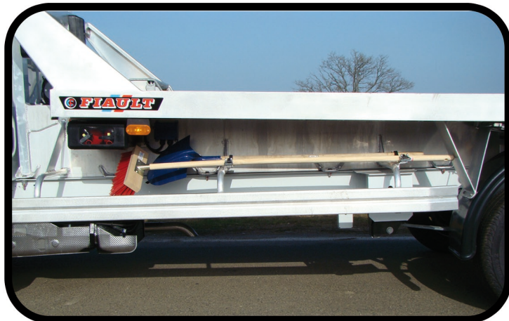
* Equipement carte blanche pour dépannage