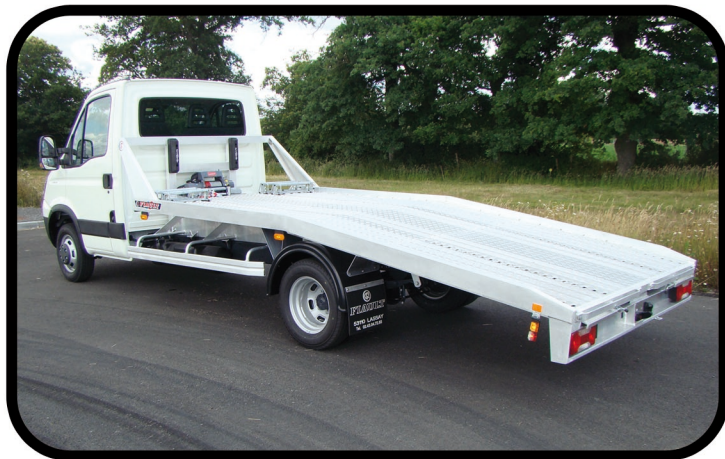
- Faux châssis et plateau les plus légers du marché