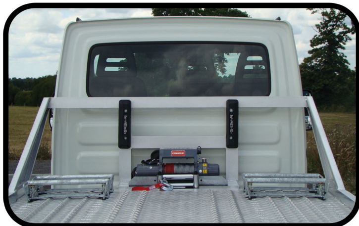
- Roll bar de protection de cabine avec butoirs caoutchouc