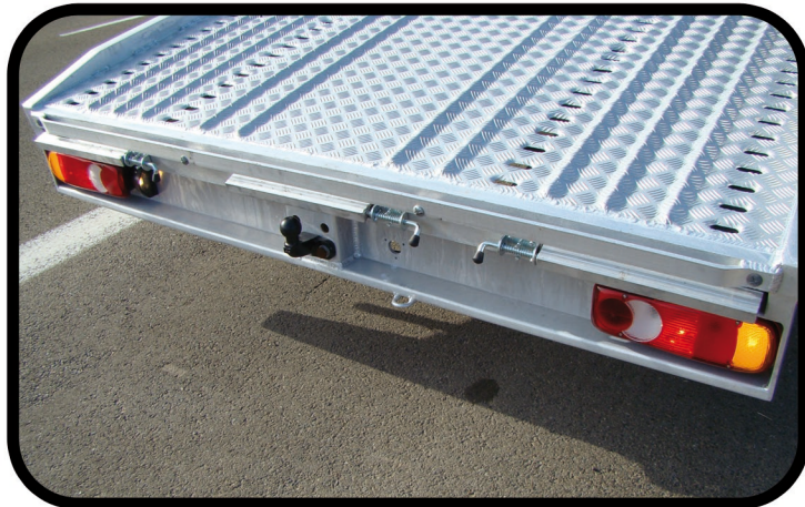
- Rampes de chargement encastrées dans le plancher et réglables sur toute la largeur